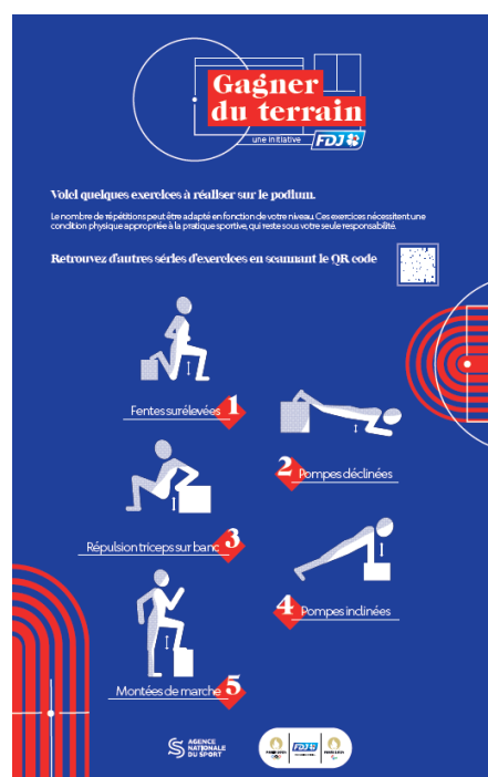
Exemple de panneaux

Ces dessins présentent un exemple des habillages des éléments composant la zone d'échauffement telle qu'imaginée par les Partenaires. Chaque zone d'échauffement s'adaptera à son environnement, aux caractéristiques du terrain (dimensions, type de sol, nivellement) et à l'équipement sportif associé.