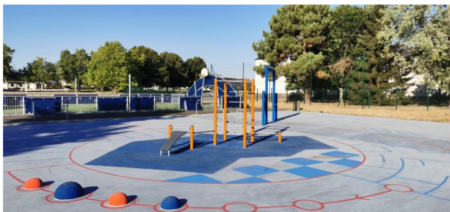
Aire de Fitness - Le Lude (72)