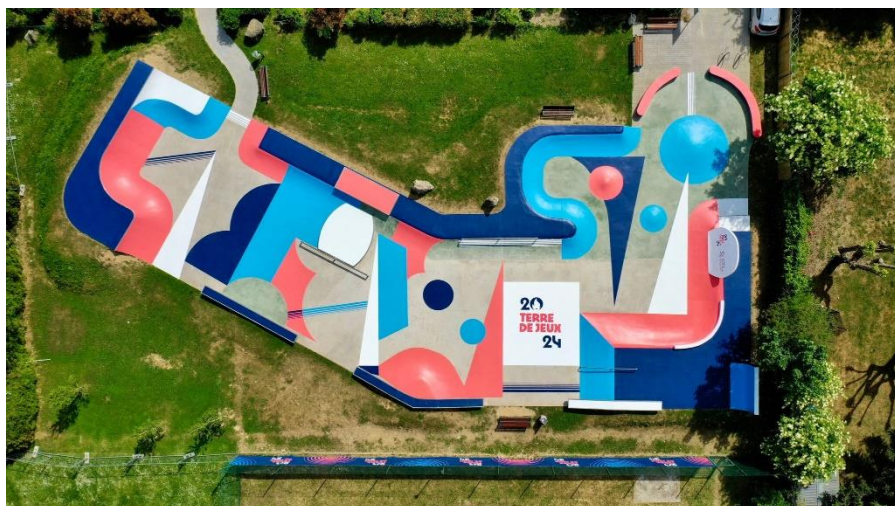
Skate-park - Pontoise (95)