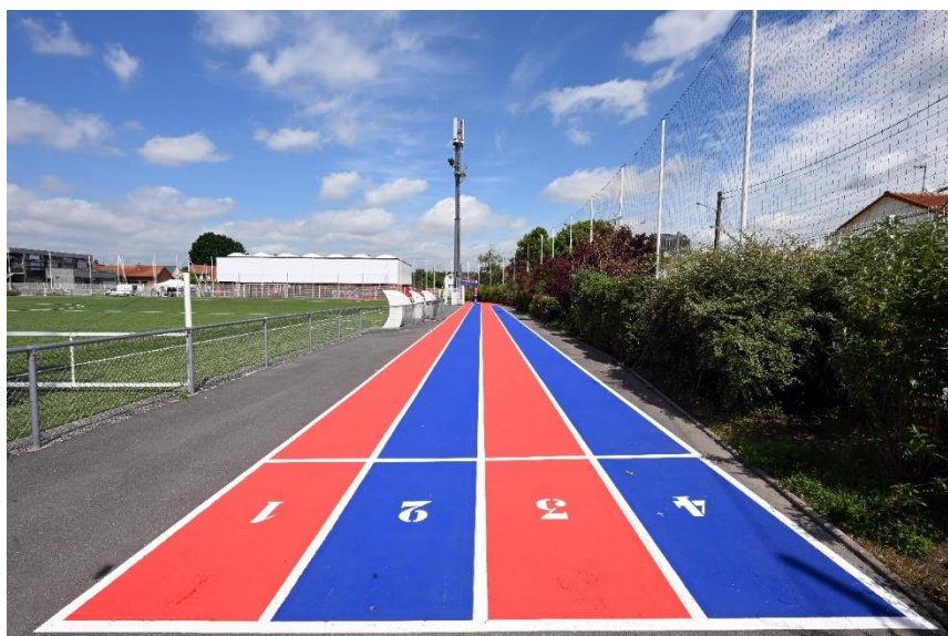
Piste d'athlétisme de proximité – Tremblay (93)